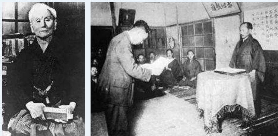
Gichin Funakoshi (1868°-1957 + ) - Otsuka ontvangt zijn shodan van Funakoshi

Gichin Funakoshi Sensei adapteerde een aangepaste judogi en het kyu/dan-gradensysteem in een poging het Karate-do makkelijker aanvaardbaar te maken bij de Japanners.