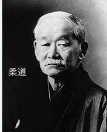
Jigoro Kano (1860°-1938 + )

Pas in 1886 treedt voor het eerst het systeem in werking van het dragen van een zwarte gordel (obi) als symbool voor een dan-graad. Deze zwarte gordels waren niet dezelfde als deze die judo- en karateka's vandaag dragen. Tot 1907, toen de moderne judogi met de huidige gordel werden geïntroduceerd door Kano Sensei, droegen de leerlingen hun dagdagelijkse kimono's die werden samengebonden met een erg brede zwarte band. Alle niet dan-graden droegen een witte gordel, sommige scholen maken later hierop een uitzondering door een bruine gordel voor de hogere kyu-graden voor te behouden.