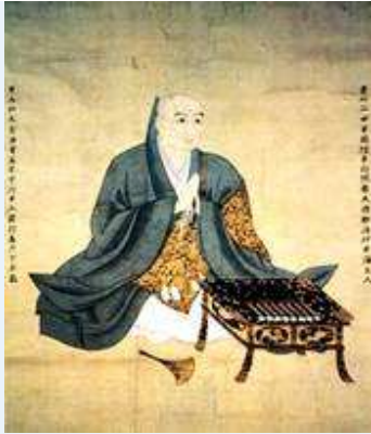
Honinbo Sansa Meijin