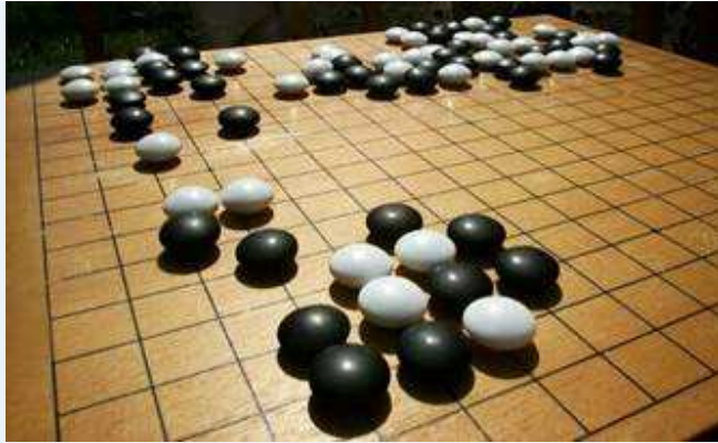
het Go spel

Na de uitspraak van Nobunaga mocht elke winnaar van een Go-wedstrijd voor één dag de titel “Meijin” dragen. Sansa gaf les aan Nobunaga, Toyotomi Hideyoshi en Tokugawa Ieyasu die hij beschouwde als 5e dan spelers, al zal enige diplomatie deze zienswijze waarschijnlijk niet vreemd geweest zijn. Tussen 1612 en 1940 werd de titel van “Meijin”, 9e dan, tien keer toegekend. Er kon maar één “Meijin” zijn op hetzelfde moment. De “Jun-Meijin”-graad (half-Meijin) of 8e dan werd 16 keer uitgereikt tijdens dezelfde periode.