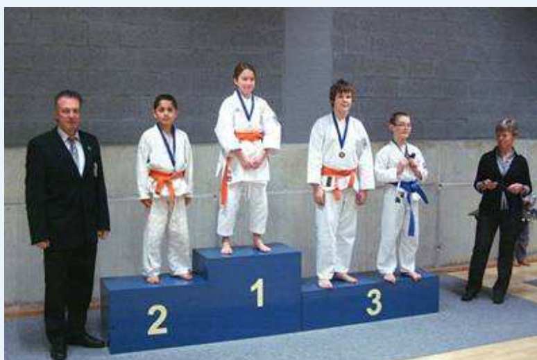
Categorie oranje gordels :