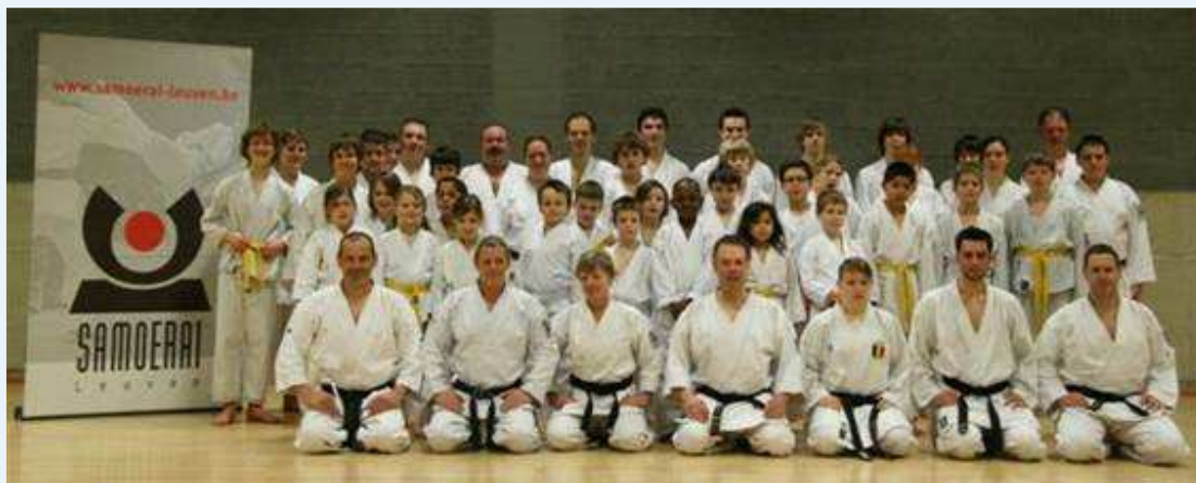
foto vorige gemeenschappelijke training

Deze groepstraining zal doorgaan op zaterdag 16 oktober 2010 van 10u00 tot 11u30.