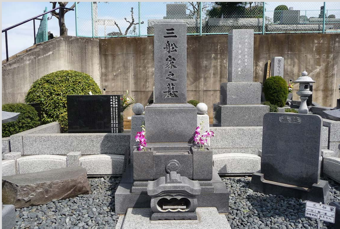
Toshiro Mifune's graf in Kawasaki, Kanagawa.